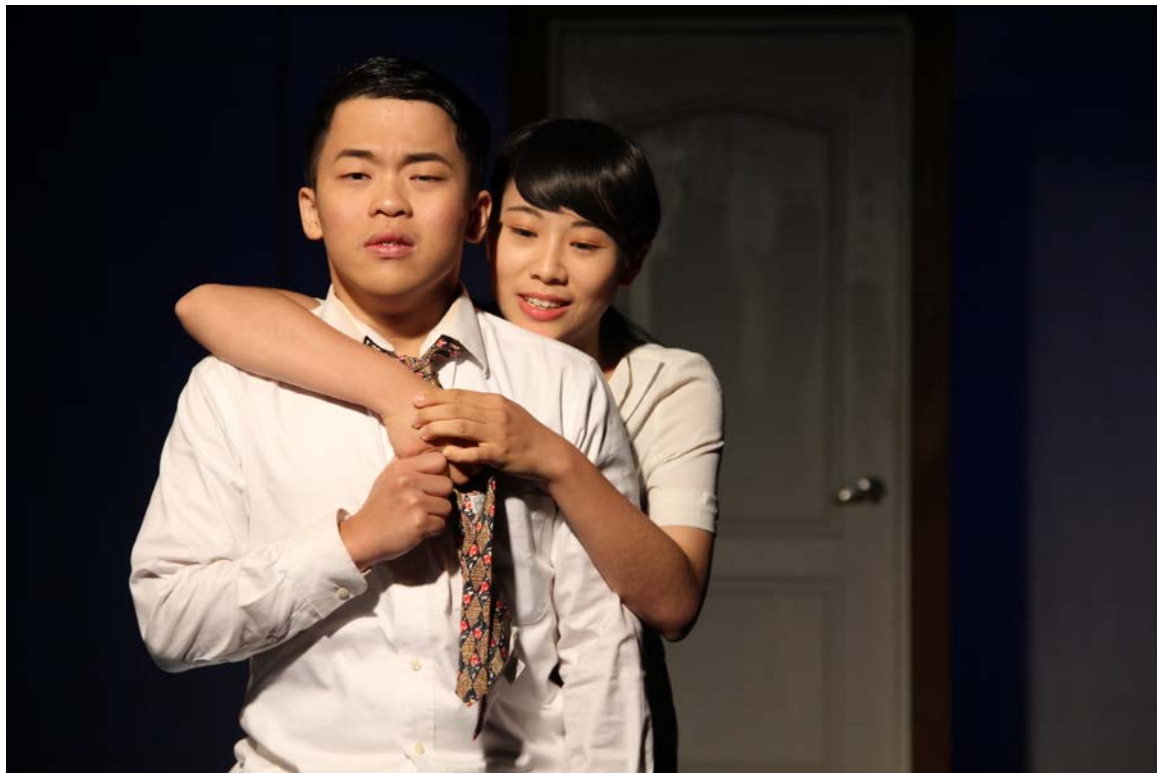
《帶一籃水果去看她》