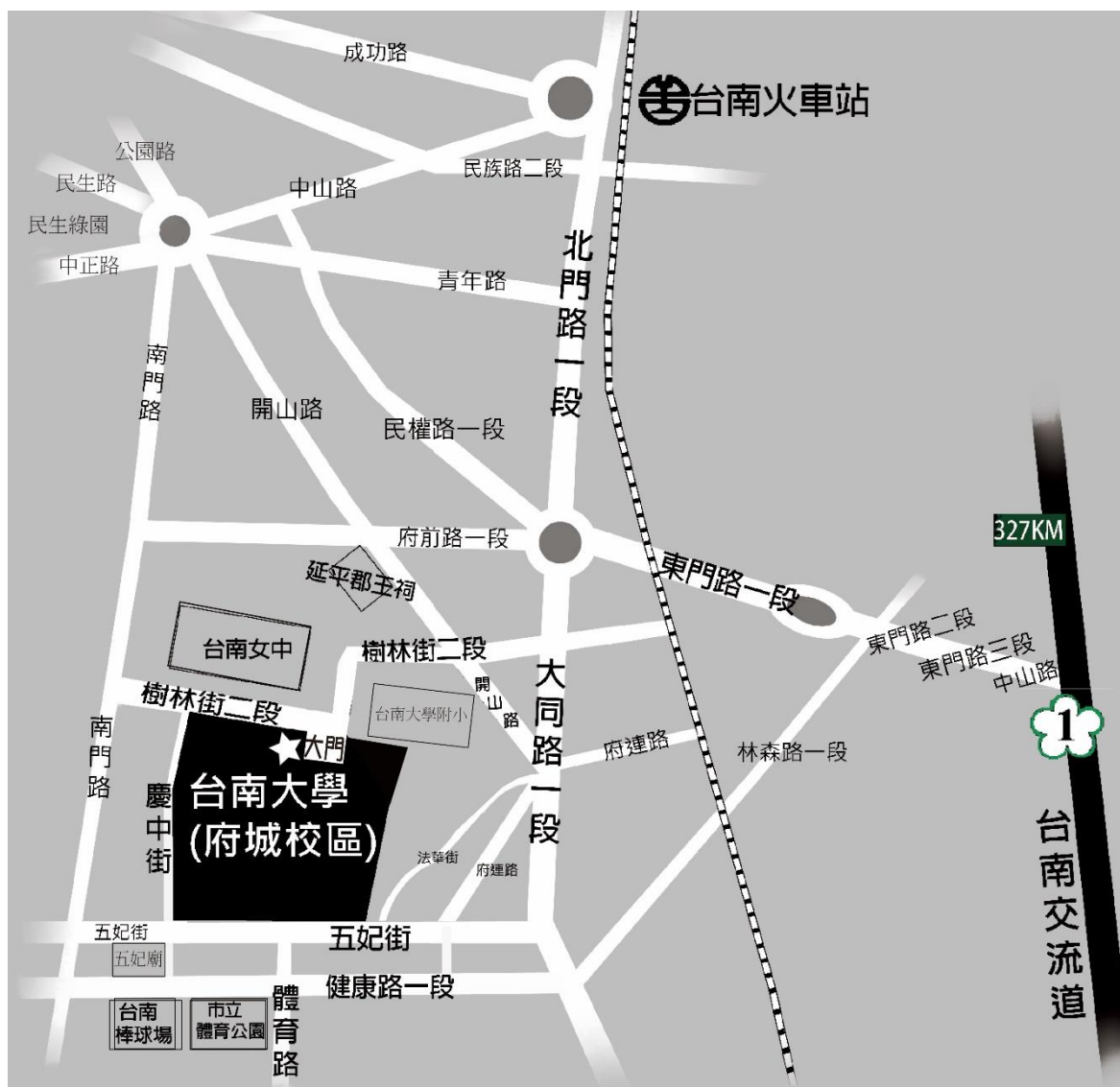
國立臺南大學府城校區交通位置圖