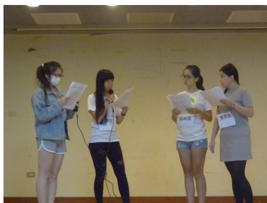
說明：各組現場展演創作的兒童劇本。學生用心表演詮釋劇本。圖為「誰能吃蘋果」展演發表。