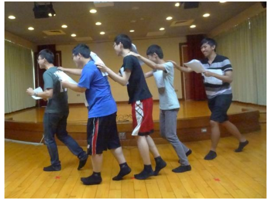
說明：學生表演時加入創意增添戲劇趣味。圖為「賣玉蘭花的小男孩」組，人體火車跑入觀眾席，與台下觀眾互動。