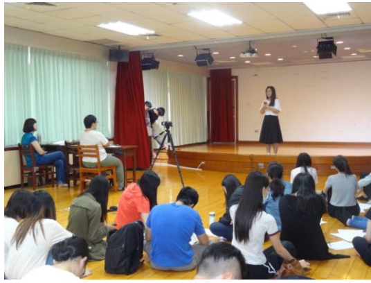
說明：活動當天，所有人專注欣賞讀劇展演發表，並於表演結束後寫下評語。