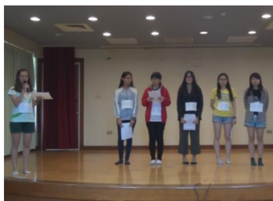
說明：05/15發表會當天，各組於展演之前說明創作理念及構想。圖為「小黃奇遇記」展演發表。