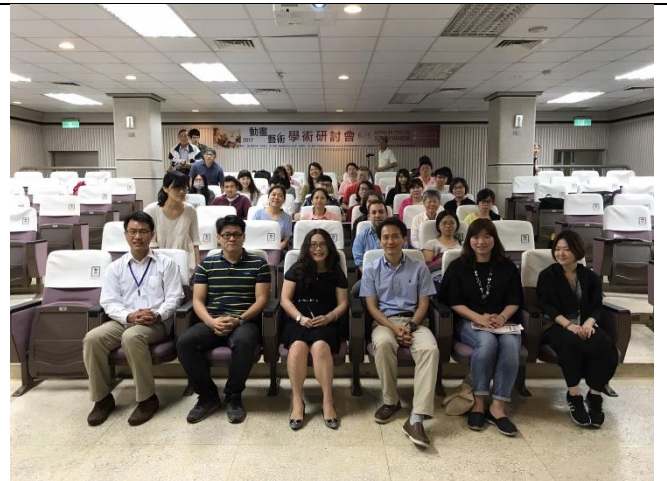
參與學員與師長全體大合照