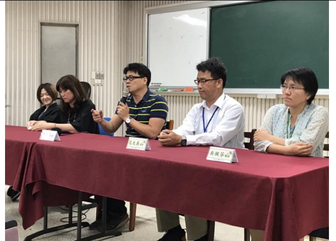
研討會暨成果發表會講評時間，所長講評